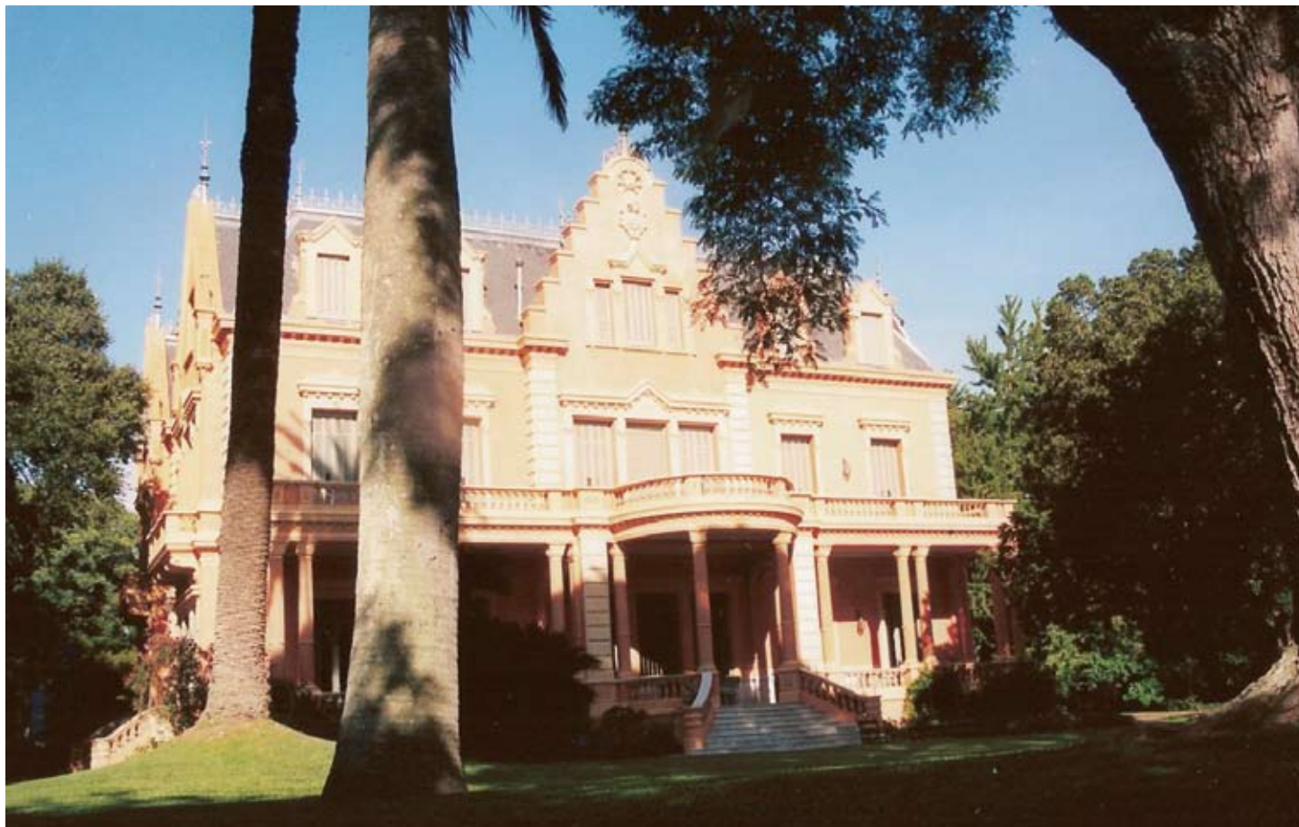
LA FACHADA ORIENTADA HACIA AL RÍO, EN LA QUE SE VE, EN EL PRIMER PISO EL BALCÓN DEL CUARTO DE VICTORIA

Se está llevando adelante la restauración y la conservación de su patrimonio, en el marco del Proyecto Villa Ocampo de la UNESCO, para convertirla en un lugar de encuentro de intelectuales, artistas y creadores de todos los orígenes.