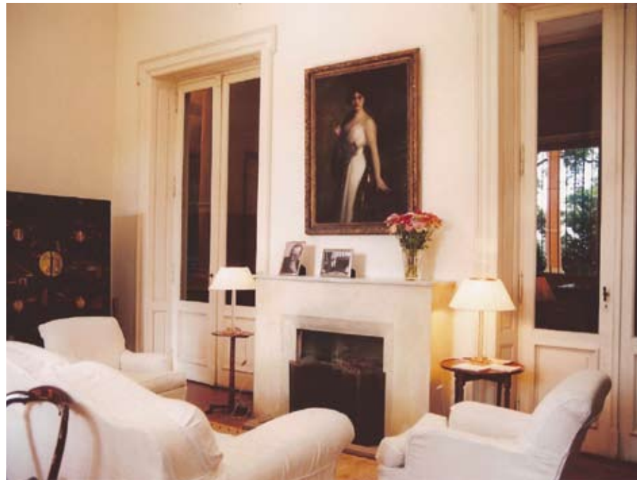
SALA DE MÚSICA