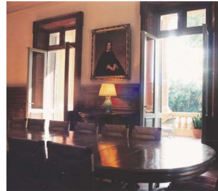
EN EL COMEDOR SE REVALORIZÓ LA BOISERIE LUSTRANDOLA CON CERA