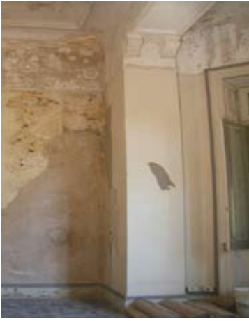
LAS PAREDES INTERIORES PRESENTABAN DAÑOS CAUSADOS POR EL AGUA