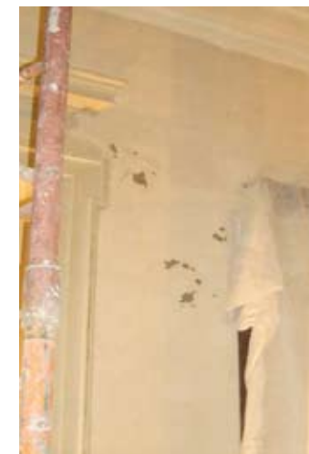
EN EL HALL DE INGRESO SE COMPLETARON LOS FALTANTES DE COLOR

Los elementos del parque, como caminos, fuente, mirador y estatua, se encontraban desfigurados a causa de la vegetación que los cubría a la pátina del tiempo.