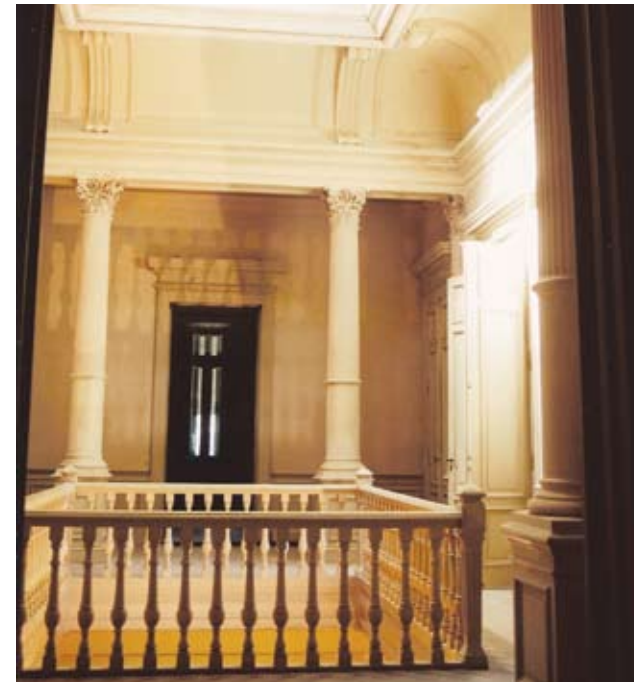
LOS CUARTOS DEL PRIMER PISO SE ORGANIZAN ALREDEDOR DE UN ESPACIO??