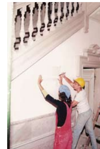
LA REPARACIÓN DE LA ESCALERA DE ENTRADA MANTIENE EL CRITERIO