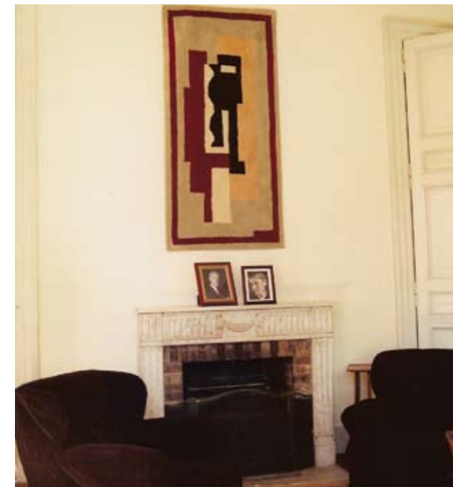
SALA DE LECTURA EN PB. EN LA QUE LOS MUEBLES SE INTEGRAN ???