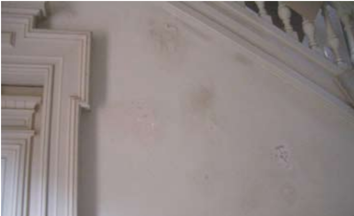
LAS ZONAS QUE PRESENTABAN EXFOLIACIONES DE LA PINTURA ORIGINAL

antecomedor para brindar confort a los visitantes.