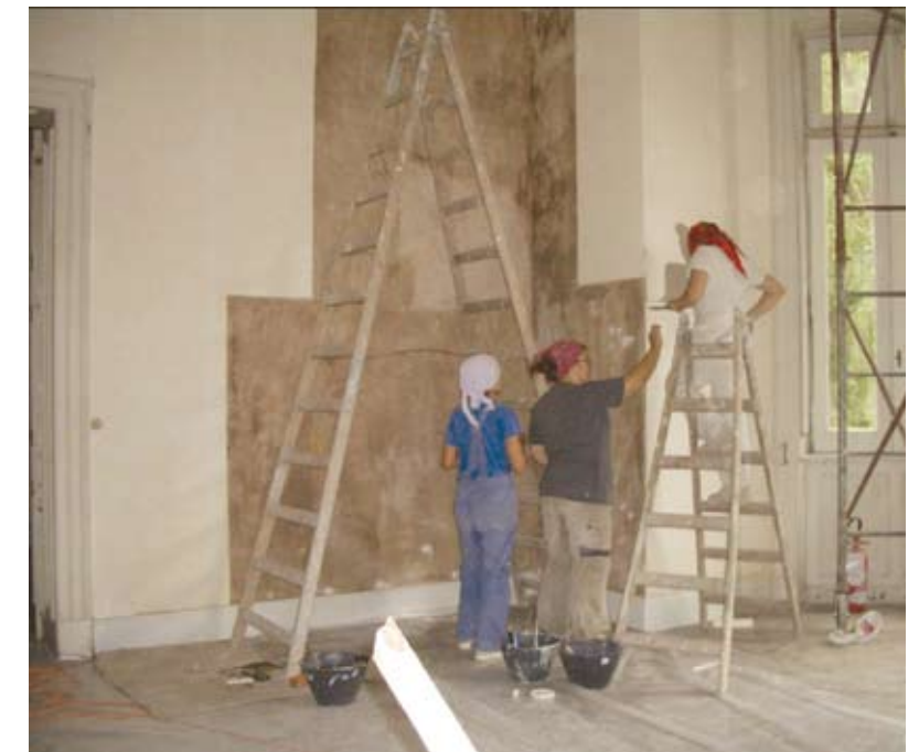
EN ESTA IMAGEN SE VE COMO SE RECUPERARON LAS PARTES FALTANTES

con muros empapelados o cubiertos con telas con motivos florales de colores saturados, característicos del fin de la era victoriana.