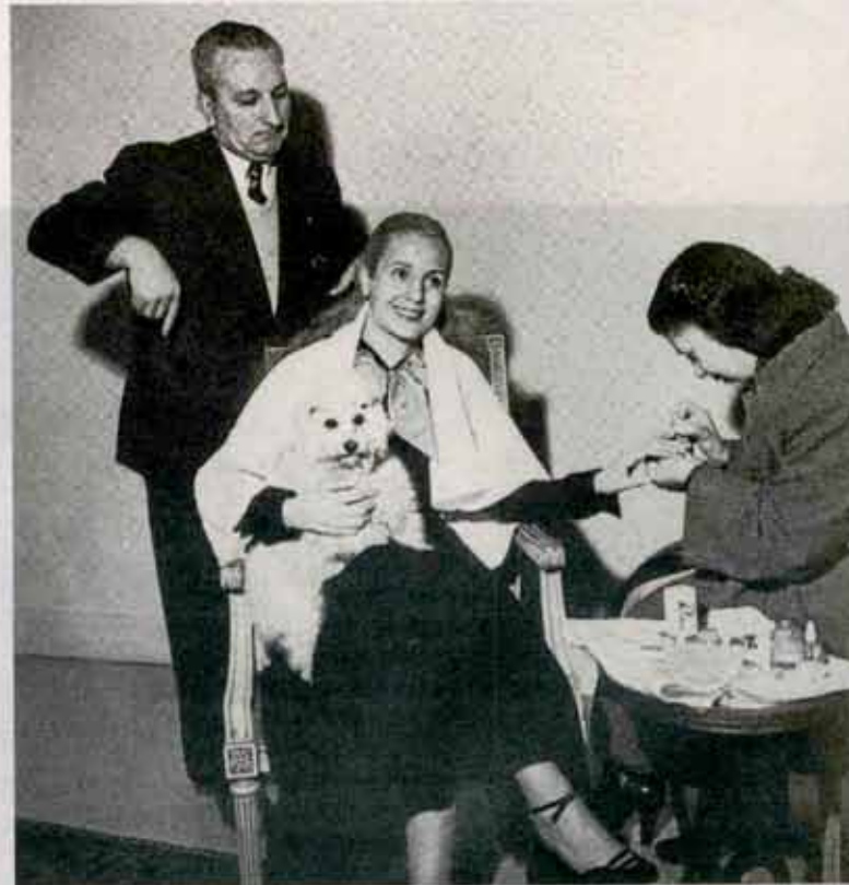
Eva era tan argentina como Victoria, y Victoria, tan revolucionaria como Eva.

Es la expresión de toda una generación que se había equivocado sobre Victoria Ocampo. Victoria es tan argentina como Evita, y podríamos arriesgarnos a decir que, a su manera, acaso tan revolucionaria como ella. ★